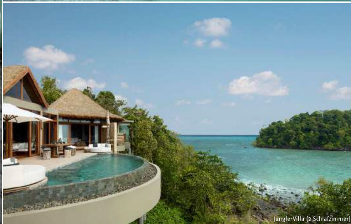
Jungle-Villa (2 Schlafzimmer)