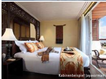
Kabinenbeispiel | Jayavarman