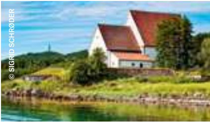
Die Trondenes Kirche