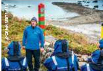
Die russische Grenze