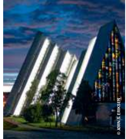
Die Eismeer Kathedrale